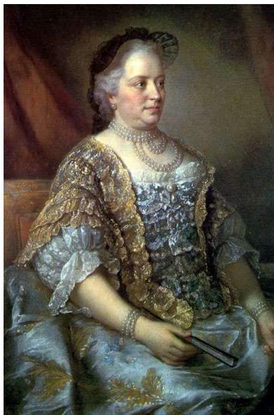
Marie Terezie (13. května 1717 - 29. listopadu 1780)

Již od 16. století začínala města Koruny České vydávat požární řády, které obsahovaly nejen opatření proti vzniku požáru, ale i úkoly obyvatelstva, zejména pak řemeslníků, v případě vypuknutí požáru. Až poté následovala „jednotná nařízení“ pro celé naše území. Nejprve císařovna Marie Terezie dne 21. srpna 1751 vydala „ Řád k hašení ohně pro města zemské, městečka a dědiny markrabství moravského “ (pro Slezsko pak 27. března 1756). Jedním z konkrétních opatření v boji proti ohni vyplývajících z tohoto „Řádu...“ pak byla stavba zvoníček.