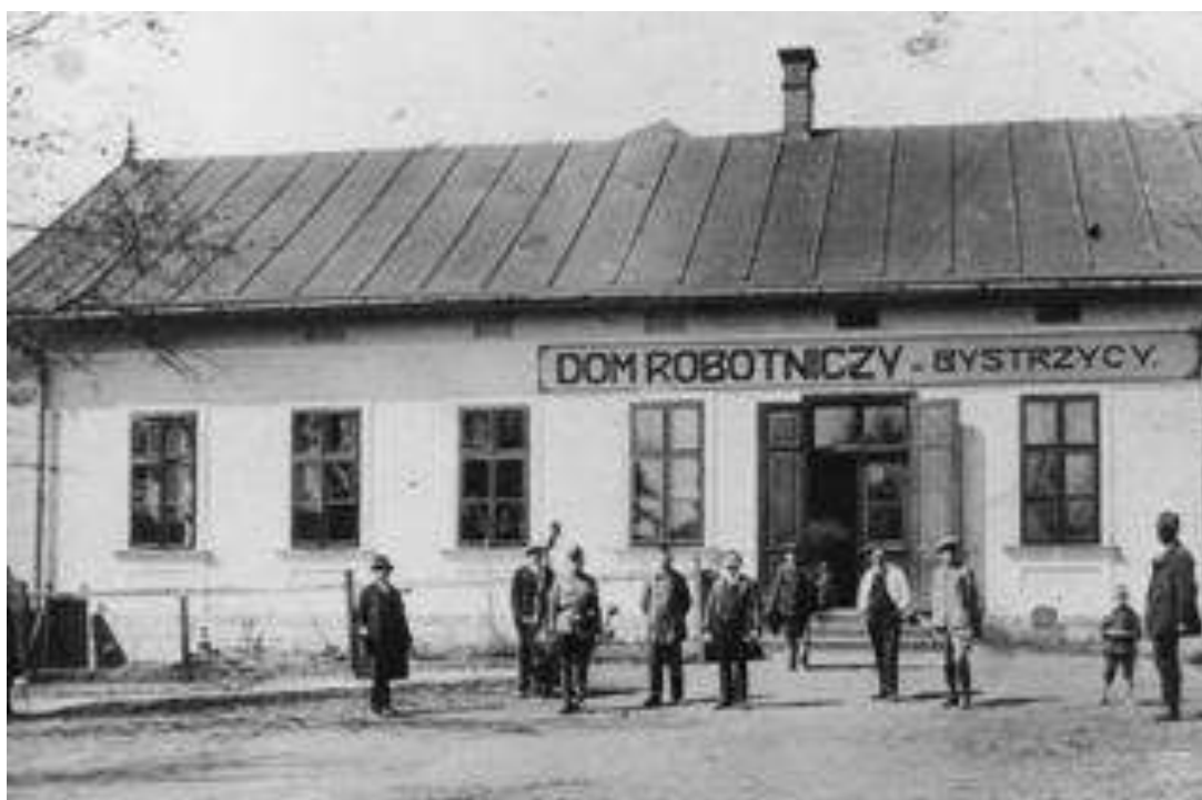
Dělnický dům