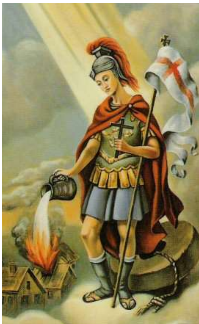
Svatý Florián 2)

Vraťme se však ještě ke vzniku hasičských sborů