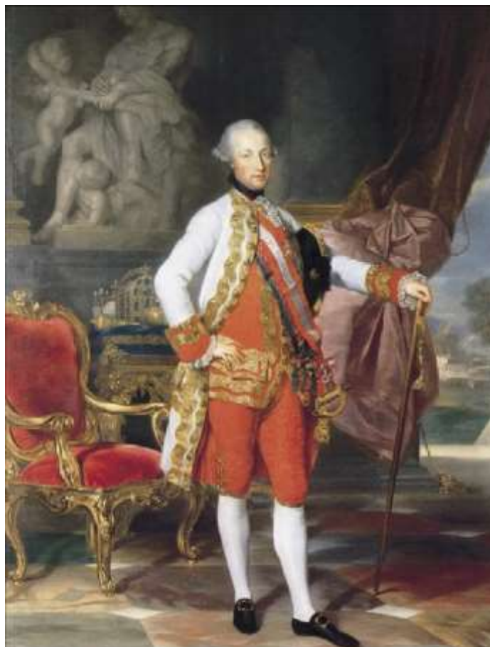
Císař Josef II. (13. března 1741 - 20. února 1790)

Hrozilo-li nebezpečí rozšíření požáru, měli zbourat i stavení vzdálenějších sousedů, především střechy rohových domů. Nejnamáhavější úkol měli řezníci , kteří museli zajít k radnici pro stříkačky , přenést je, kde jich bylo právě zapotřebí, a začít spolu s kotláři stříkat , zatímco mlynáři a pekaři se svými vědry zásobovali stříkačky vodou . Soukeníci a koželuzi byli pověřováni dozorčími službami měli dbát na dodržování pořádku, pečlivě hlídali všechny věci vynesené z ohrožených domů a uložené na volném a bezpečném prostranství, aby nebyly ukradeny- trest za rozkrádání zachráněného majetku byl jasný – useknutí ruky. Nelze opomenout, že v 17. a 18. století se na Těšínsku začal utvářet kult sv. Floriána, který měl nadpřirozené schopnosti chránit před ohněm . Svatý Florián je dodnes považován za patrona profesí, které souvisejí s ohněm – hasičů, hutníků, kominíků, hrnčírů či pekařů. V ikonografii je představován obvykle v oblečení římského důstojníka s nádobou na hašení, případně přímo hasící požár. Jeho kult byl rozšířen i na Těšínsku a jeho sochy se budovaly na ochranu proti požáru.