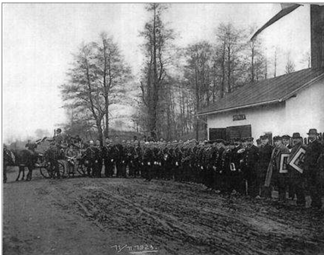
Od roku 1917 do 1. září 1939 nesl sbor název - Ochotnicza straż pożarna

Po rozpadu Rakousko - Uherska v roce 1918 v Bystřici převládali, z hlediska národnostního složení, občané hlásící se k polské národnosti. Proto došlo k přejmenování místního hasičského sboru z německého Freiwillige Feuerwehr na polský Ochotnicza straż pożarna.