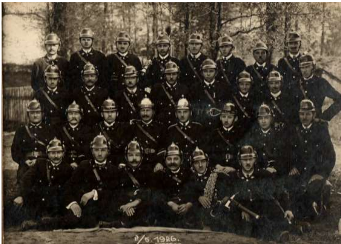
Sbor dobrovolných hasičů .- Ochotnicza straż pożarna 1926

V roce 1928 Sbor dobrovolných hasičů vlastnil : 2 čtyřkolové stříkačky, 2 malé stříkačky ruční, 1 výbrojový vůz, 4 žebříky na střechu 2 vozíky na hadice a kolem 600 m hadic. Téhož roku měl sbor 49 činných členů a 32 přispívajících. Ochotnicza straż pożarna byla členem tzv. „Związku Polskich Straży Pożarnych v Československé republice“ a ten patřil „Zemské hasičské jednotě v Opavě. Sídlem „Związku...“ byl Český Těšín.