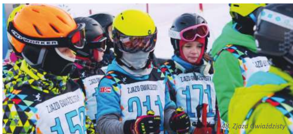
48. Zjazd Gwiazdzysty